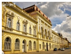
Universitatea din Oradea- Facultatea de Medicină și Farmacie Oradea – sediul central