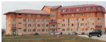
Universitatea din Oradea- Cămin studențesc, Campus I

f). Spații de cazare în patru cămine studențești (C1 – cămin băieți, C2 – cămin fete, C3 – cămin mixt, C4 – cămin mixt) cu 1.435 de locuri de cazare. Trei dintre cămine (C1, C2 și C4) sunt amplasate în Campus I și unul în oraș, acesta din urma fiind în proprietatea Primăriei Oradea și închiriat de către Universitatea din Oradea pe o perioadă de 10 ani.