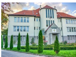
Universitatea din Oradea Campus Central

Universitatea din Oradea (UO) se definește ca o instituție de învățământ superior situată la granița de vest a României având un rol decisiv în dezvoltarea socio-economică și culturală a zonei geografice unde își desfășoară activitatea. Pornind de la acest rol, UO și-a asumat un spectru larg de domenii de învățământ care să acopere cerințele unei dezvoltări durabile a acestor domenii atât la nivel național cât și internațional prin recunoașterea activității depuse după absolvire de către absolvenții acestei universități cât și prin rezultatele științifice ale personalului didactic. Dacă perioada 1990-2007 s-a evidențiat printr-o „dezvoltare pe orizontală” a universității, iar perioada 2007-2012 etapă de tranziție privind implementarea învățământului european bazat pe Procesul Bologna, începând cu anul 2012 , UO și-a consolidat calitatea proceselor proprii de învățământ și cercetare printr-o dezvoltare pe „verticală”. În anul 2022 , Universitatea din Oradea a fost cooptată în Alianța EU GREEN , o alianță transnațională de universități europene al căror scop este de a fi o “universitate a viitorului” https://www.eugreenalliance.eu/ . EU GREEN are scopul de a deveni „un centru european extins pentru educație, cercetare și inovare în dezvoltarea durabilă care depășește granițele consorțiului și acționează la nivel global, pentru a oferi soluții la provocările locale sau regionale ce pot fi replicate la nivel global”.